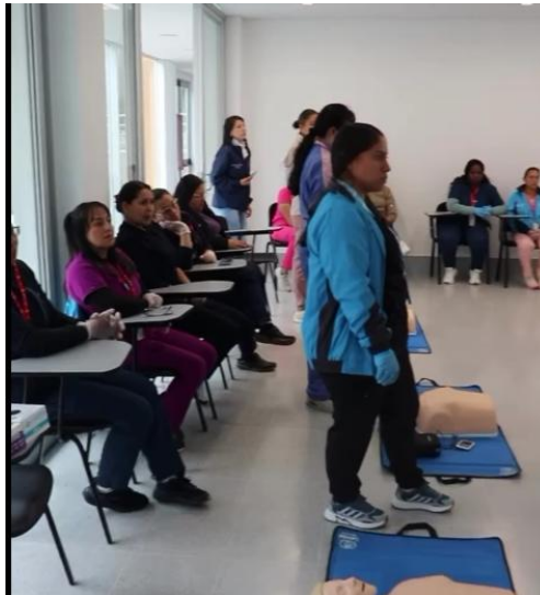
Ilustración 5. Equipo participante 24 de abril de 2026