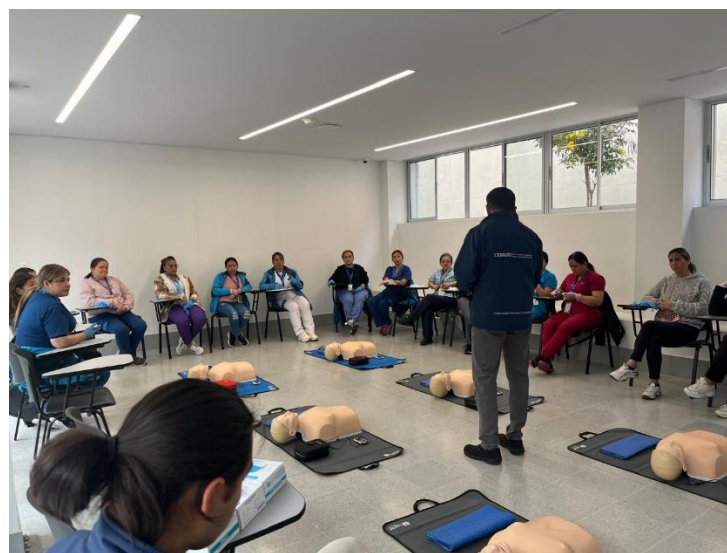
Ilustración 4. Equipo participante 21 de abril de 2026