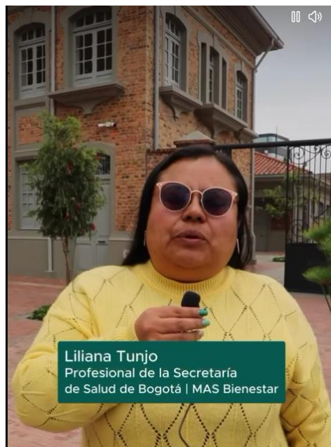
Ilustración 5. Toma Video:

https://www.facebook.com/reel/960587543025206